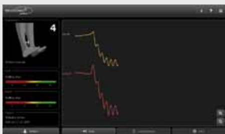
Fase di esercizio

Il Venoscreen Plus è un dispositivo intuitivo, facile e pronto all'uso. Dispone di una stampante termica integrata e di un tablet touch screen per eseguire l'esame, visualizzare le misure e i risultati.