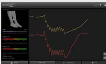
Fase di acquisizione